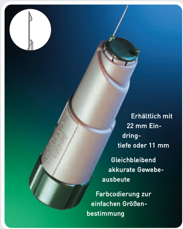
Typ Monopty* Biopsiesystem

MONOPTY* AUTOMATISCHES EINMAL-BIOPSIESYSTEM